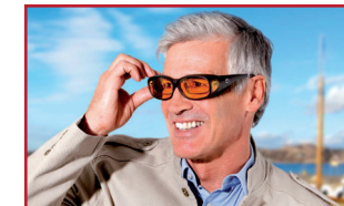
Schutz der Netzhaut